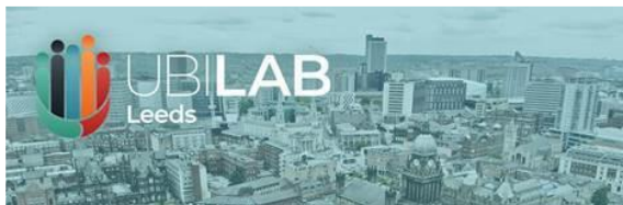
UBI Lab Leeds, United Kingdom