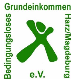
Association Unconditional Basic Income Harz/Magdeburg, Germany