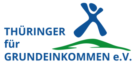
Thuringian for Basic Income, Germany