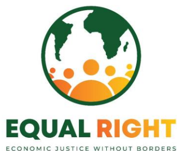
Equal Right, United Kingdom