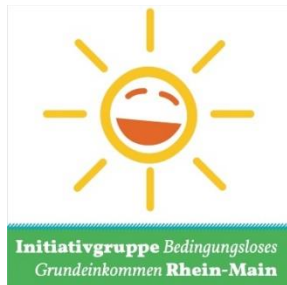
Initiative Group Unconditional Basic Income Rhein-Main, Germany