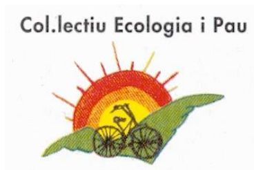
Collective Ecology and Peace, Spain