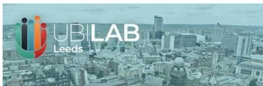
UBI Lab Leeds, United Kingdom