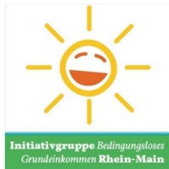
Initiative Group Unconditional Basic Income Rhein-Main, Germany