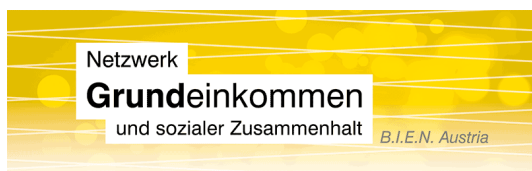
Network Basic Income and Social Cohesion – B.I.E.N. Austria