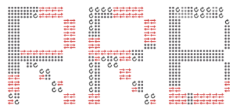
Basic Income Network (Spain)